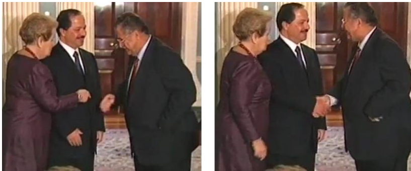
Wezîra k'arên derva ya DYA Madlên Olbrayt' Mesûd Barzanî û Celal T'elebanî tîne bal hev û ji wan r'a dibêje – destê biratîyê bidin hev!

– Baş e, eger, em bibêjin, k'urdên R'ojava çûn Hewlêr û Dihokê li bal “Barzanîyê xwedî xêr”, ewê çi ji wan r'a bibêje? Dê wan hîn bike, çawa R'ojava di nava xwe û wan encaman û enîyên ji hêla Zanîyarîya PDK û MIT-a T'irkîyayê va li ser k'axezan hinartî da p'arç'e bikin? Ma we jibîrkirye, çawa wezîra k'arên derva ya Amêrikayê Madlên Olbrayt'